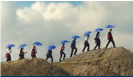
Ergebnisse der „Werkstatt für neue Landschaften“, 2001