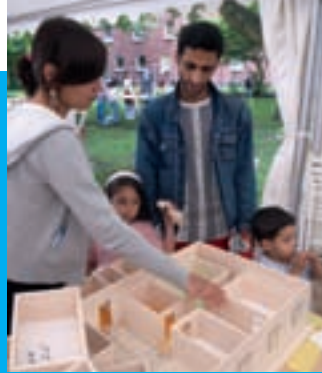
Bewohner während einer internationalen Planungsworkstatt