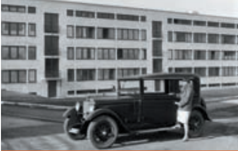
Mies van der Rohe, Apartmenthaus, 1927