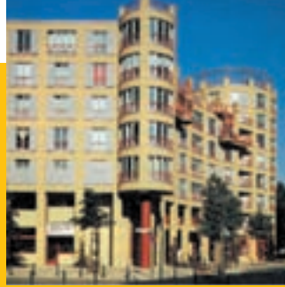
Gottfried Böhm, Wohnbebauung am Prager Platz