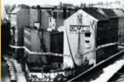
Hausbesetzungen im Block 89 rund um das Fränkelufer in Kreuzberg, 1981