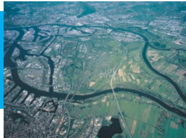
IBA-Gebiet aus der Vogelperspektive