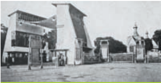
Haupteingang zur Ausstellung 1901