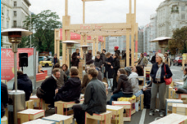
Etwa 60 Interessierte fanden sich anlässlich des Symposiums bei PARK ein