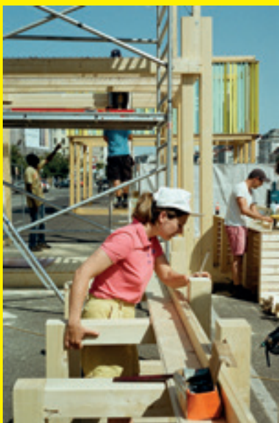
Aufbau in Kooperation mit NUT UND FEDER