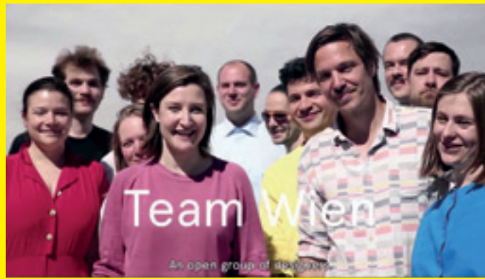
Ausschnitte aus dem Crowdfundingvideo