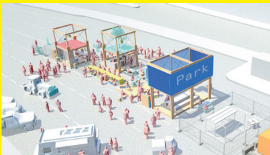
Visualisierung von PARK zu Projektbeginn